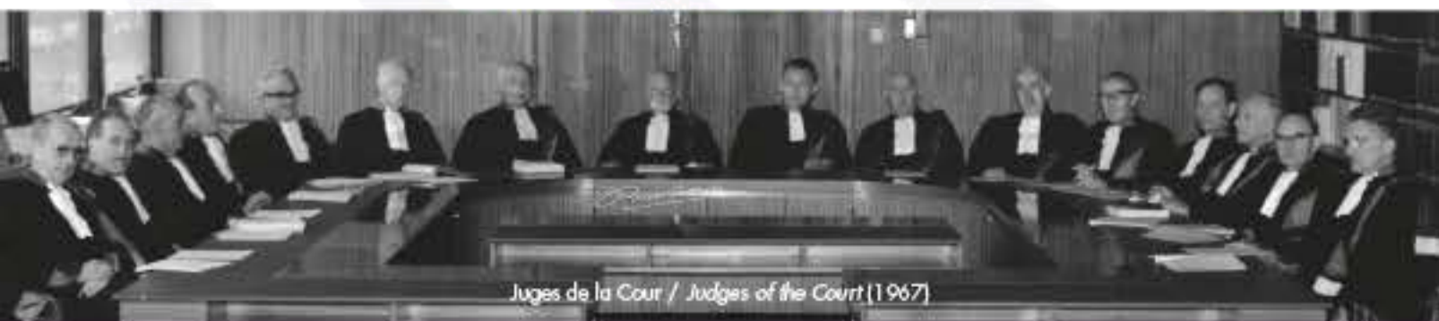
Juges de la Cour / Judges of the Court (1967)

'The proclamation of rights means nothing without supervisory measures.'