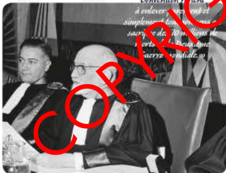
Affaire Lawless c. Irlande / Case of Lawless v. Ireland (1960)

About the Convention 'Put simply, not to ratify the Convention would be tantamount to discounting the sacrifice of the 70 million who died in the Second World War.'