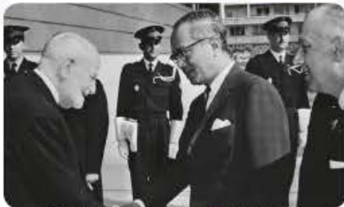
Visite de U Thant, Secrétaire général de l'ONU / Visit of U Thant, Secretary-General of the UN (05/02/1966)

« La proclamation de droits n'est rien sans mesures de contrôle. »