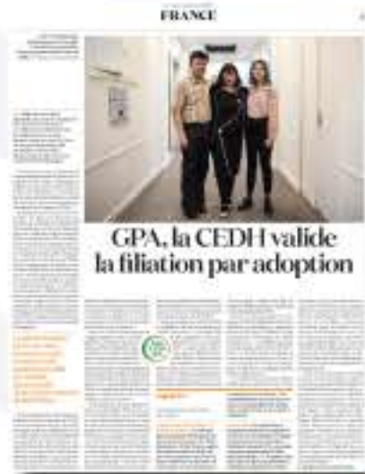
GPA, la CEDH valide la filiation par adoption