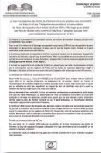
La Cour rend son 1 er avis consultatif / The Court delivers its 1 st advisory opinion (10/04/2019)