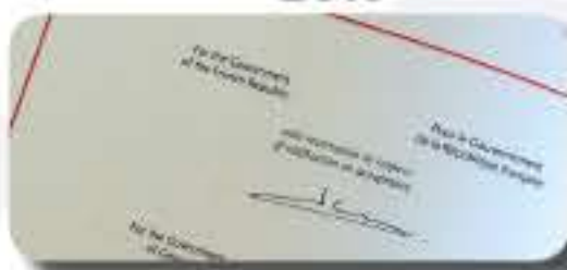
La France signe le Protocole n° 16 / France signs Protocol No. 16 (02/10/2013)