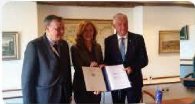
Guido Raimondi, Président de la CEDH / President of the ECHR, Nicole BELLOUBET, garde des Sceaux, ministre de la Justice / Minister of Justice, Thorbjørn Jagland, Secrétaire général du Conseil de l'Europe / Secretary General of the Council of Europe

Dépôt de l'instrument de ratification du Protocole n° 16 (Copenhague, 12/04/2018) Deposit of the instrument of ratification of Protocol No. 16 (Copenhagen, 12/04/2018)