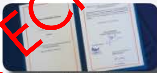
La France ratifie le Protocole n° 16 / France ratifies Protocol No. 16 (12/04/2018)