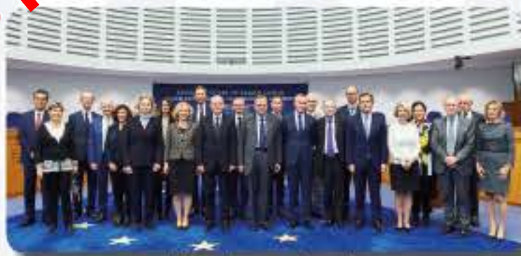
Visite de la Cour de cassation informant la CEDH de la demande d'avis consultatif / Visit from the Court of Cassation informing the ECHR of its request for an advisory opinion (05/10/2018)